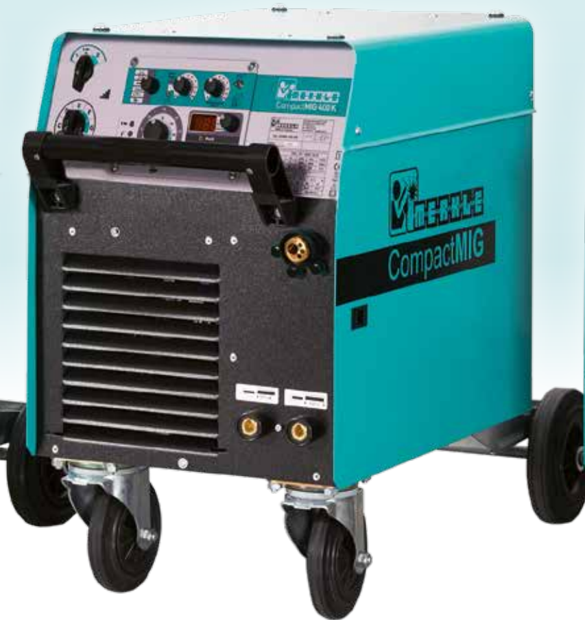
CompactMIG 400 K