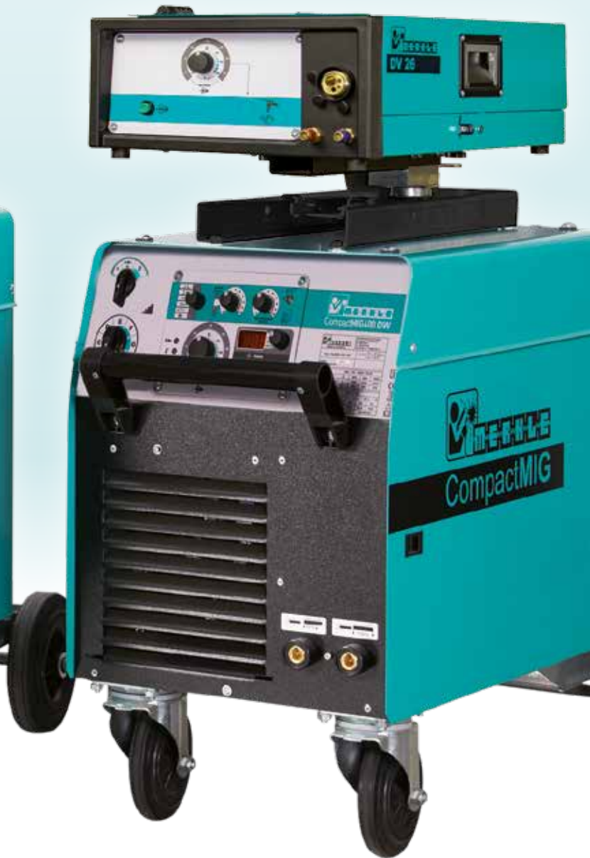
CompactMIG 400 DW