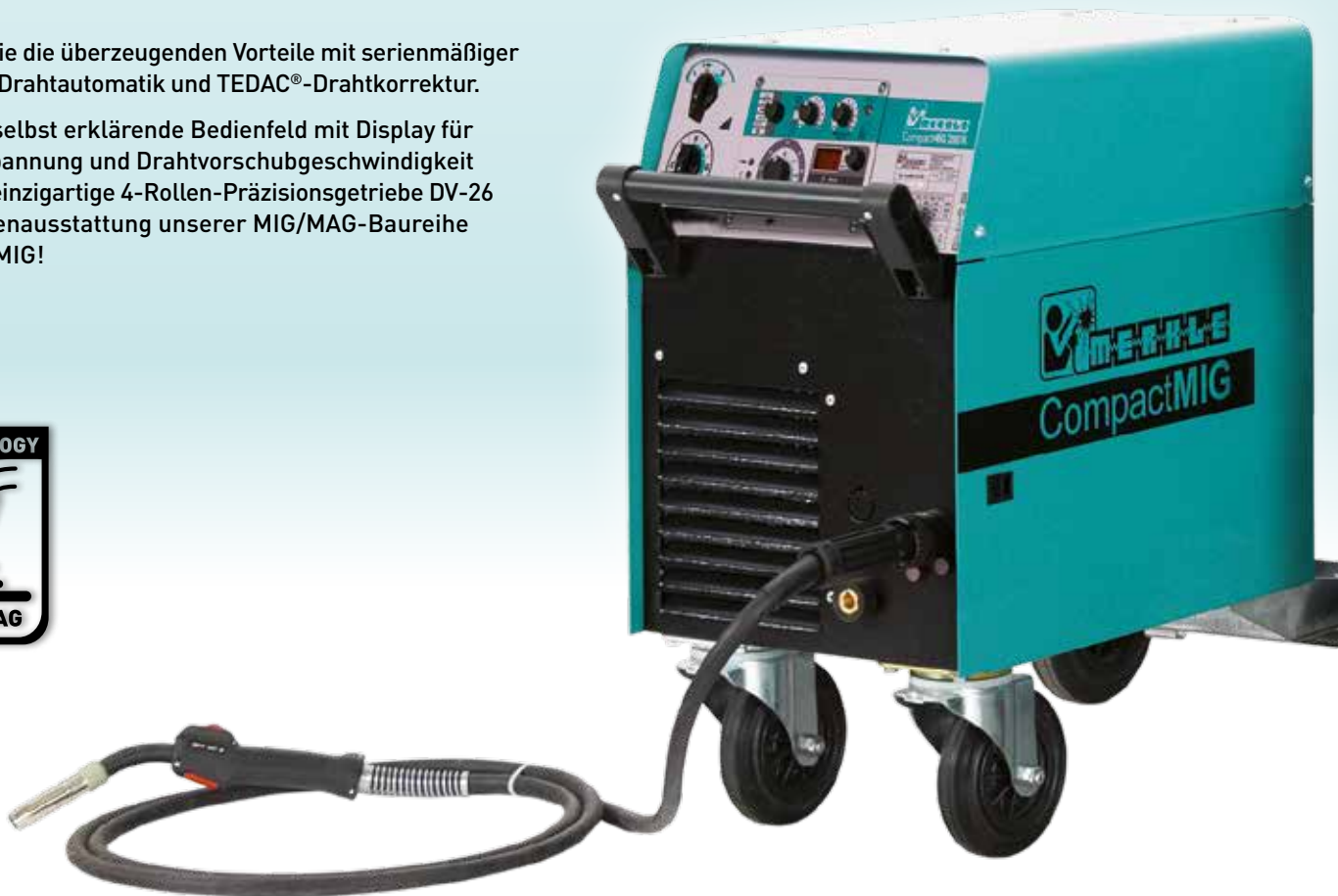
CompactMIG 280 K